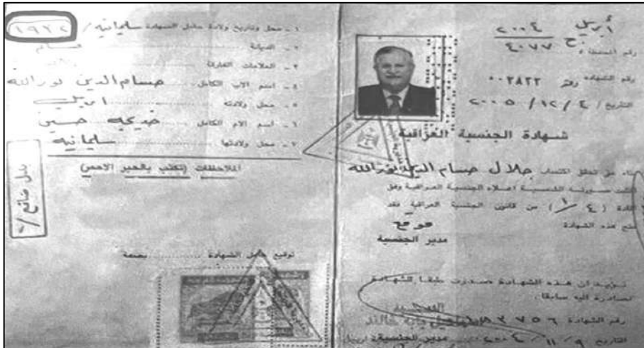
ره‌گه‌زنامه‌ي عيراقی مام جه‌لال