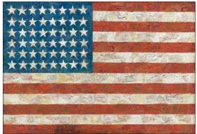
جاسپەر جۇنس ئالا، ۱۹۶۴ (شيوەى ۳)

(ھىربەرت ماركۇس) باوهرى وايە كە «تەكنە لۆژيا بە شيوەيە كى بەردەوام كۆشش بۆ خولقاندنى مروقى نووى دەكات، مروقتىك نوپنەرى بەكاربردنى پروگىرى (الاستىفازى) بىت تا ئەوپەرى پروگىرى و ھەتا دروشمە كەيشى بىتە (من بەكاربەرم، كەواتە من ھەم)، لە بەكاربەرەو بۆ ھونەر، لە دەستەبژىرەو بۆ مىللى و لە ھونەرەو بۆ پەيوەندىكردن.. ھونەر مەندىش لە داھىنەرەو دەگۆرپت بۆ بەرھەمپنەر و خەونەكەي دەپھىننەتە دى، وەكو ئاندى وارھول كە ھىواي ئەو ھى خواست بىتە ئامىر». (محمد: ۲۰۱۵، ل ۲۱).