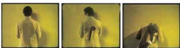
پیته ر كامپوس، سئ ترانزیشن، ۱۹۷۳ (شیوه ی ۷)

به داهیتانی فیدیۆ و به كارهیتانی له هونه ردا، توانایه کی نوئی به بهر هونه ری شیوه كاریدا كرد و په ره سه ندنی هۆكاره كان و ژماره ییه كان تا ده گاته كامیرای ژماره یی ئاست بهرز و له فهزای ته كنه لوژیای زانیارییه كان و سیسته می ژماره یی كۆمپیوتهر بووه ئامرازیکی نوئی و به داهیتان و سه ره له دانی بۆ ناو هونه ر، بووه ئامرازیك بۆ گه ران ده رباره ی ئه و نمووانه ی شاشه پیشنیازیان ده كات و له گه ئیشیدا خود و تاكگه راییی ون ده بیئت. چونكه وینه گوازیاره وه بۆ ته كنه لوژیا و ئاسۆیه کی گه ش به ره و جیهانی گریمانه یی كرابه وه و له ماوه یه کی كورتدا شیوازی زۆر به دوا یه كتریدا هاتن و دۆخی په قبیان گۆری بۆ شه به نگ و چه مکی تابلۆش گۆرا و بووه شاشه. (محمد: ۲۰۱۵، ۵۴ ل و ۵۷). له به ناوبانگترین هونه رمه نده كانی ئه م بزووتنه وه یه تیری كیندزل، دان گراهام، پیته ر كامپوس. (شیوه ی ۷).