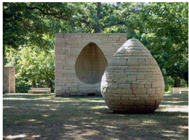
ئاندى گوڵدسوۆرسی، تیکه له کیشبوونی کات، ۲۰۰۱ (شیوه ی ۱۵)

به کاره پێنان (تیشک) بووه، له کاتی خۆرئاوا بوون، یان هه لاتینیدا و به گه پرخستن و به کاره پێنانی له شیوهیهکی ئه ندازه یی دروستکراو له چیمه نتۆ (Malpas: ۲۰۰۳, p1۱۲) که چی هونه رمه ند (کریستۆ و جین کلۆد) پرووبه ره کانی وه کو پرووبه ری ده ریچه یه ک، یان ته لاری گه وره و زلی به هۆی قوماشی پلاستیکییه وه داده پۆشی و به رگ ده گرت. (ئه ندی گوڵدسوۆرسی) ش (شیوه ی ۱۵) مامه له ی له گه ل که ره سه ته خاوه هه مه ره نگه کانی وه کو به رد و تاویر و ئاو و دره خت و لق و گه لا و خۆلی له گه ل به فر و به سه ته له کدا ده کرد، له کو تا کاره کانی دا جه ختی له سه ره به کاره پێنانی به رد ده کرده وه. (Goldsworthy: 2008, p66). هه ره یه که له هونه رمه ندانی هونه ری زه وی بیروکه ی دیاریکراوی خۆیان هه بوو، هه ره یه که شیان به شیوه و شیوازی خۆی ویستیان ئه و بیروکانه له ریگه ی به کاره پێنانی که ره سه ته خاوه کانی سروه ته وه له شیوه و وینه و میکانیزمی جوړاوجۆره وه به بینه ر بگه یه نن.