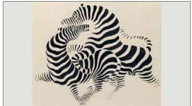
فیکتور فاسارلی، كه ری کئوی ۱۹۳۸ (شیوه ی ۶).

به چه ندین ناوی دیکه ش ناسراوه. وه كو هونه ری بینین، هونه ری جو له یی، یان هونه ری (الصبرانی). «پشت به یاریكردن و هه لئه تانندن به چاو ده به ستیت، ئه وه ش به به كارهیتانی ره نگه دژه كانی وه كو ره ش و سپی و شیوه ئه ندازه ییه كانی وه كو چوارگۆشه و سئ گۆشه، هونه ری بینین (البصری) بریتیه له شیوه ی ئه ندازه یی لیوار تیژ». (وید: ۱۹۸۸، ۲۲ ل). له گرنگترین هونه رمه ندانی ئه م هونه ره ئه لكسه نده ر كالدرو فازاریلی (شیوه ی ۶).