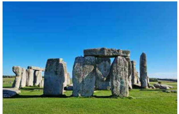
ستۆن هانگ، به ریتانیا، (شیوه ی ۸).

لاند ئارت له هونه رو ئەفسانه پۆشنیبری و کولتوورییه کۆنه کانه وه سوودی بینیه، که ماوه یه کی درێژه فه وتاون و زۆربه یان نه ماون. له کولتووری به ردینی (ستۆن هانگ) (شیوه ی ۸) له ئینگلته را و نه خشکارییه گه وه کانی (ئه نکیه کان و ئەزسته کیه کانی) سه ر زه وی. که له کۆندا بۆ په یوه ندی کردنی نیوان زینده وه ره شاراوه کان و هیزه میتافیزیکییه کان یان ئەوانه ی پشت سروشته وه به کار هیناون. ئەم هونه ره په گوریشه ی بۆ هۆزی پیرو له باشووری ئەمه ریکا ده گه رپته وه، کاره کان له هه ندیک هیمما ئالۆز پیک هاتوون، بۆچوونه کان بۆ ئەوه ده چن که «ئهو هیممایانه ده گه رپنه وه بۆ شارستانی نازکا (شیوه ی ۹) له نیوان ۴۰۰- ۶۵۰ زاینی. تا ئیستا ئەوه نه دۆزراوه ته وه که چۆن یان بۆچی ئەو ویتانه به و شیوه یه کیشراون، له سه ر رووبه ریکی فراوان که جیهانی سه رسام کردوه». (بلاسم، سلام: ۲۰۱۵، ل ۶۹).