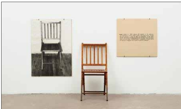
جوزيف كوزوس، يەكېك لەسنى كورسىيە كان، ۱۹۶۵، نيويورك (شيوەى ۵)

بايەخ بە «بىرۆكە دەدات، يان چەمك وە گواستنه وەى ئەو بىرۆكەيە بۆ وەرگەر، چونكە ھونەرى چەمكە رايى، يان ھزرى، تيايدا جەخت لەسەر ھزر و مېشكى پاك و بىگەرد دەكرېتەو». (ال وادي: ۲۰۱۱، ص ۱۸۰). ئەم ھونەرە نوپنەرايە تىيى قۇناغىكى چالاكىي نىوان بىرۆكە و بەرھەمى كۆتايى دەكات، لە گرنگترين جۆرە كانىشى (ھونەر — زمان)، (ھونەرى جەستە) و (ھونەرى زەوى) لەدواييدا بە تاييەت باسى دەكەين. گرنگترين و ديارترين ھونەر مەندانى ھونەرى چەمكە رايى جۆزىف كوسوٹ (شيوەى ۵).