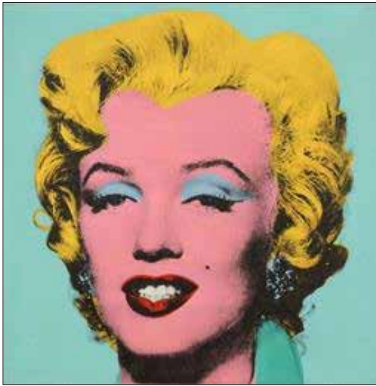
مارلين مونرو، ئاندى وارھول، ۱۹۶۷، (شيوەى ۴) ۳-۲-۲ ھونەرى چەمكە رايى (الفن المفاهيمى):