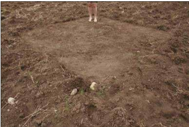
نەھرۆ شەوقى، چىپى پى، ۲۰۱۶ (شېۋە ۱۱)