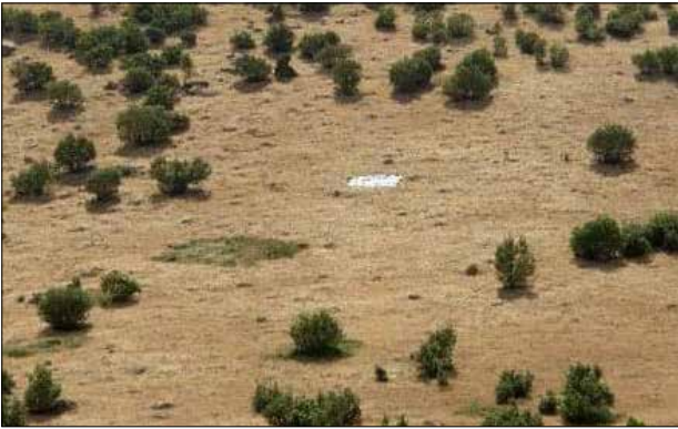
ئازەر عوسمان، پەلە، ۲۰۰۳ (شېۋە ۱۰).