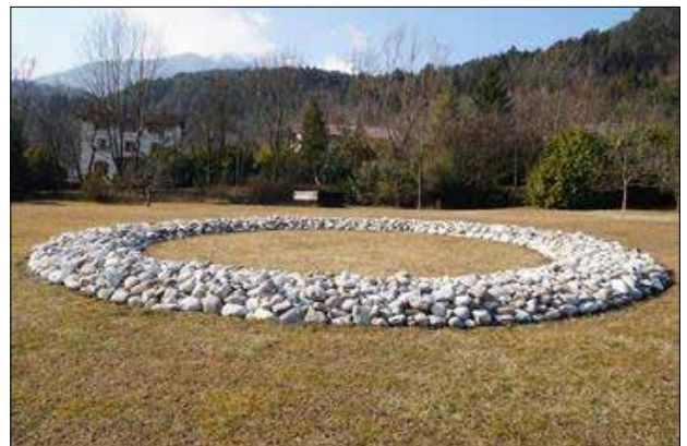
رىتجارد لۇنگ، رۇبارى بازنەى بەردىن، ۲۰۰۱ (شېۋەى ۱۳)

شۆستەى بەندەرى سىبىرالى لوۋلپىچ، ۱۹۷۰ (شېۋەى ۱۲)