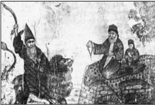
سولتان سەھاك و حاجی بەگداش فرینی شیر (martin van, 1991, 56)

ئەفسانەى پیروۆزی بەرد لە لایەن بروادارەوھ لە زۆربەى ئایینەكان باوھ، سالانە سەردانى دەكەن پارچەبەك لەو بەردە دەبەنەوھ بۆ مالهوھ وەكو پیروۆزیەك (موتفەرک) سەیری دەكەن، زۆر جار لە كاتی