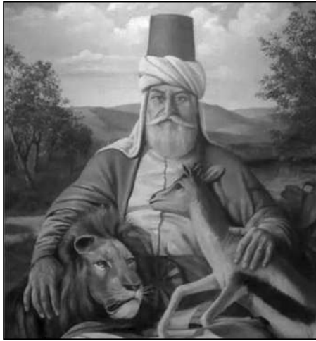
حاجی بەگتاش (oriental religion) series, 1984, 37-38

پەيامبەرەن. حاجی بەگداش خۆی دامەزرێنەری ئایینی بەگداشییە و لە پێگە ئایینیە کەیدا بە تەجسیدیکی خودایی دادەنێن، بە مردنی حاجی بەگداش دونیا بە بێ خوا مایەو، بۆیە دەلێن لە ئاسمان بە دواى خودا مەگەرێ. واتا ئەو کەسانە چاویان کراوێهە و دەتوانن لە ناو خەلکدا خودا بەدی بکەن (میران، ۲۰۱۷، ۲۶۹).