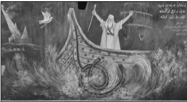
ئەفراندن، ( ئينتەرنېت )

هەندى ئەفسانە باس لەوه دەكەن، خودا بۆ تاقىکردنەوه و گوێزايەلى، تاوسى مەلەك فرى دەداتە ناو ئاگرى دۆزەخەوه، ئەويش ماوهيهكى زۆر لەوى ماوهتەوه و ئازارى كيشاوه ، به گريان حەوت