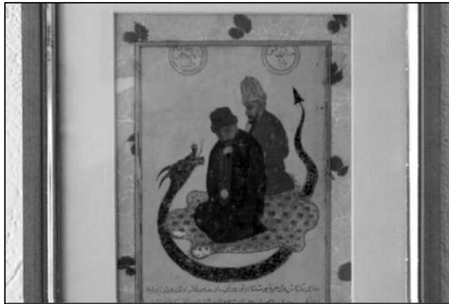
بەرمانە ئەفسانەییەکی حاجی بەگدایش (John, 1937, 274)

لە ویلایەتنامە هاتوووە کە (حاجی محەمەد حەیرانی) کە پەڕەوانی مەولانای رۆمی بوو، حاجی بەگدایش دەیویست باوەر بە زانیارییەکانی ئەو بکات. بۆیە حاجی بەگدایش بەرمانەکی لەسەر بەردیگ رادەیهی، قسە لەگەڵ بەرمانەکە دەکات و ئەمری پێدەکات کە بفری و بەرزى بکاتەو، لەو کاتە بەرمانەکە بەرز دەبیتەو و دەفری، بۆیە (حاجی محەمەد) پەشیمان دەبیتەو باوەر بە بەرزى و نەمرى حاجی بەگدایش دەکات، دواى ئەو بێنى دیوارەکە بە بەرد بوو کە حاجی بەگدایش سواری بوو، کورده بەگدایشیەکان رایان وایە ئەوئە سواری بوو دیوار بەردین نییە، بەلکو شیرە (John, 1937, 17-20): ئەفسانەى فرین هەر لە کۆنەو مەرۆف بیری لیکردۆتەو، یان بۆ ئەوئە زوو بگاتە شوینی مەبەست یان بۆ سەلماندنی توانای پەرچووی خۆی بوو لەم ئەفسانەى حاجی بەگدایش ئەمە پیش حاجی بەگدایش هەبوو، ریگەیهکی ئایینی بوو بۆ سرنج راکیشانی بیروباوەردارانی، وەکو بەرمانەکی حەزرتی سولهیمان.