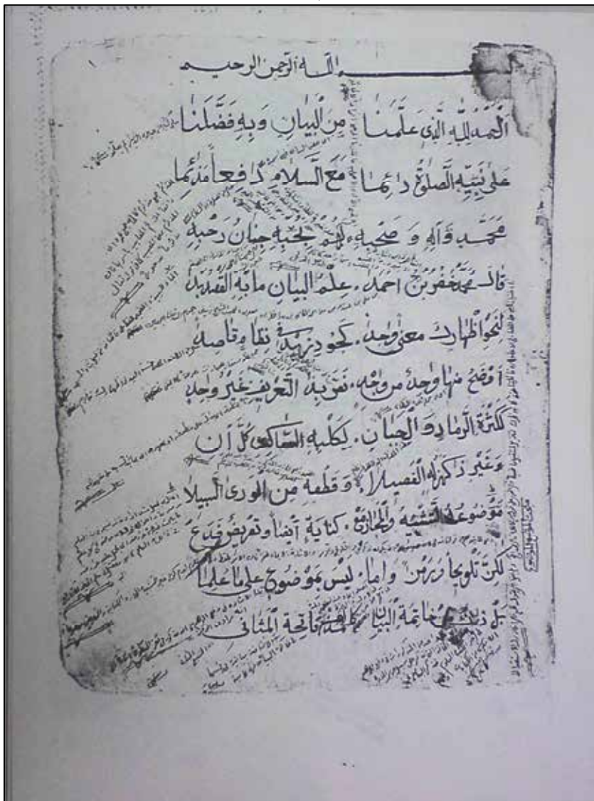
وینه لاپه‌ره‌ی یه‌که‌می ده‌ست‌ن‌و‌سی ئی‌ست‌ی‌عه‌ره‌که‌ی مه‌لا خدری ده‌شتی