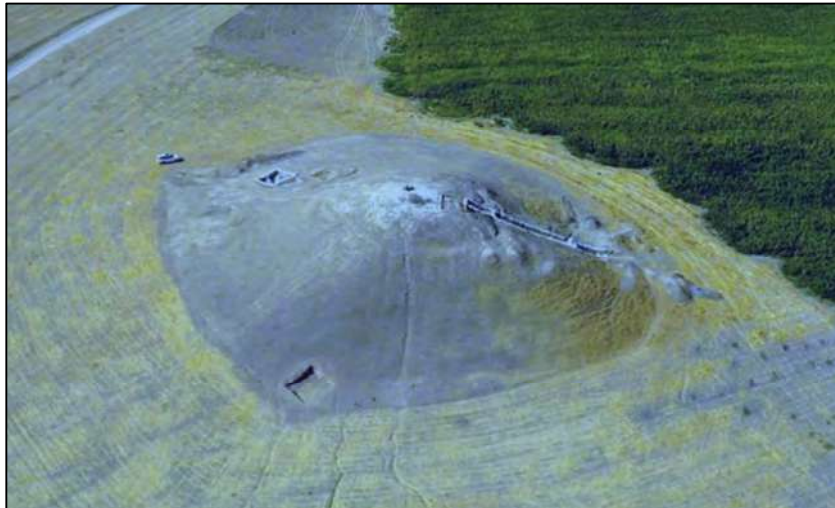
وێنە ی (۱)

گردی سورێژە گردیکی شیۆه قووجەکییە، دەکەوێتە دووری (۲۰کم) باشووری شاری هەولێرەوه لەسەر رینگای مەخمور، نزیک گوندی سورێژە ی ئیستا. رووبەری ئەم گەردە شوینەوارییە نزیکە ی ۲۲ دۆنم دەبێت، لە باکووری پۆژئاواوه بۆ باشووری پۆژهلآت (۱۱۸م) درێژ دەبێتەوه و (۱۵۰م) لە باشووری پۆژئاواوه بۆ باکووری پۆژهلآت درێژ دەبێتەوه. بەرزیی لە ئاست دەشتاییەکانی دەورووبەری (۱۶م) دەبێت و هەروەها لە ئاست رووی دەریاوه (۳۴۹م) دەبێت (Stein, 2018, 15-16; Stein & Alizadeh, 2013, 34).