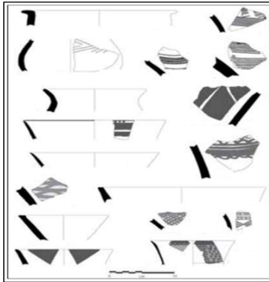
وینه ی (۴)

له راستیدا لیکۆلینهوه له پارچه گلینه به دهسته هاتوووه کان له سهر بنه مای شیوه و قهباره ی گلینه کان و ههروه ها پیکهاته ی نه و قوره بووه که گلینه کانی لپی دروست کراوه، پاشان سه رنج خراوته سه ر پله ی سوورکردنه وه ی گلینه که له گه ل وردبوونه وه له و نه خش و نیگار و رهنگانه ی له رازاندنه وه ی گلینه که دا به کار هاتوون (حسین، ۲۰۰۶، ۶۲-۶۳). نه گه ر سه رنجی پارچه گلینه کانی شوینه واره که بده یین به درێژایی وه رزه کانی کنه و پشکنینی شوینه واری به ده ست هاتوون، پاش لیکۆلینه وه ده رده که ویت که وا گلینه کان بو سه رده می چاخی بهردینی کانزایی ده گه پریته وه بو سه رده مه کانی حه له ف و عوبه یید و وه رکا (Stein, 2018, 21).